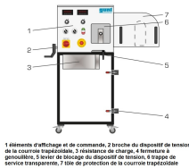
1 élément d'affichage et de commande, 2 broche du dispositif de tension de la courroie trapézoïdale, 3 résistance de charge, 4 fermeture à genouillère, 5 entretoise de montage du dispositif de tension, 6 trappe de service transparente, 7 tôle de protection de la courroie trapézoïdale