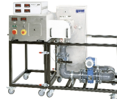
1 élément d'affichage et de commande, 2 broches du dispositif de tension de la courroie trapézoïdale, 3 résistor de charge, 4 fermeture à genouillère, 5 levier de blocage du dispositif de tension, 6 trappe de service transparente, 7 tête de projection de la courroie trapézoïdale

Le HM 365 est le module de base de la série FEMLine; il permet de réaliser des études et des expériences sur des machines à fluide.