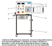
1 élément d'affichage et de commande, 2 broche du dispositif de tension de la courroie trapézoïdale, 3 résistance de charge, 4 fermeture à genouillère, 5 entre de stockage du dispositif de tension, 6 trappe de service transparent, 7 tôle de protection de la courroie trapézoïdale