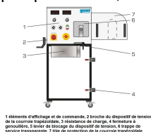
1 élément d'affichage et de commande, 2 broche du dispositif de tension de la courroie trapézoïdale, 3 résistance de charge, 4 fermeture à genouillère, 5 entre de stockage du dispositif de tension, 6 trappe de service transparent, 7 tôle de protection de la courroie trapézoïdale