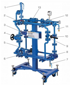
1 soupape de sécurité, 2 robinet à tournant sphérique, 3 soupape d'arrêt, 4 robinet-vanne à coin, 5 robinet à piston, 6 soupape à diaphragme, 7 robinet à tournant sphérique/raccord d'eau, 8 soupape de retenue, 9 purgeur de vapeur, 10 clapet d'arrêt, 11 purge d'air, 12 collecteur d'impuretés, 13 voyant